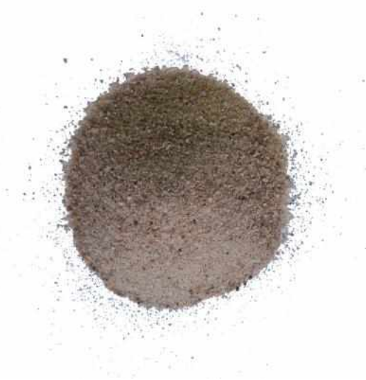
Рис. 2. Материал до измельчения