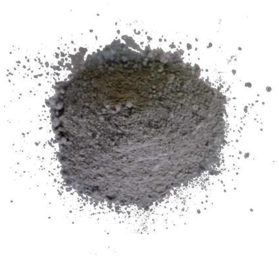
Рис. 3. Продукт измельчения